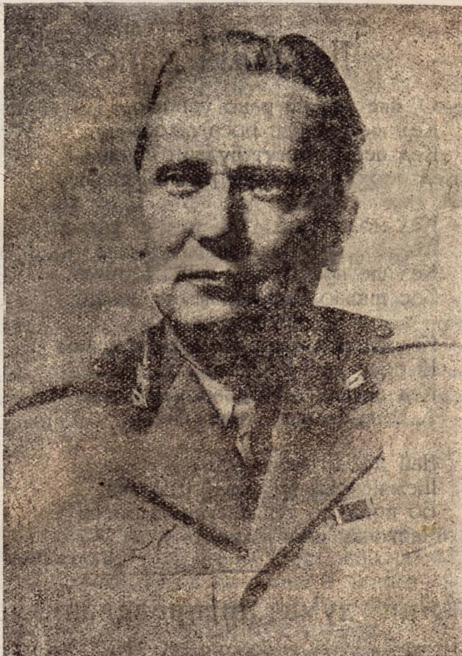
Маршал Югославиї Ссиф Броз Тито

„Заградка“ будзе мила кнїжочка, и же зос ней вельо поучице, бо наш вожд наш Маршал кед бешедовал Пиониром наглашел же Пионире маю длужносц да буду найлепши школяре и же их длужносц „уциц, учиц и вешелїц ше“.