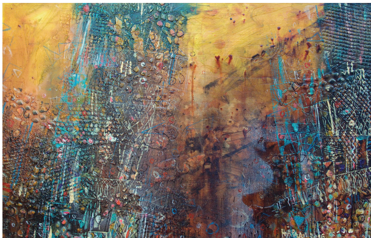
Из цикла „Карпатски хаос” 169, 2016. (комбинирана техника, 35x55)