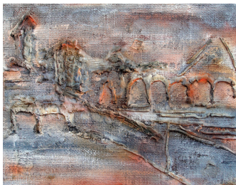
Рибница, 1986. (комб. техника, 45x56)