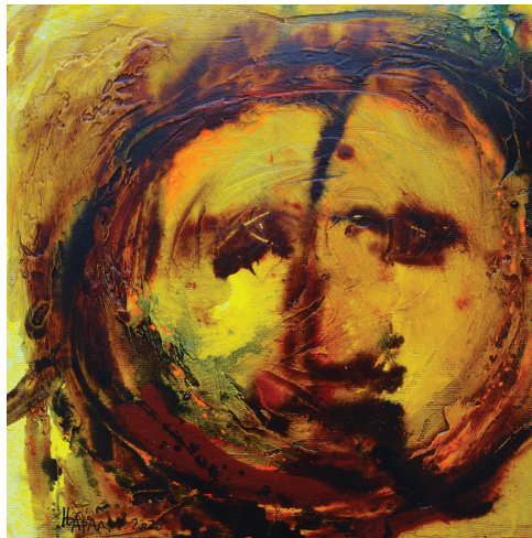
Портрет, 2020. (комбинирана техника, 30x30)