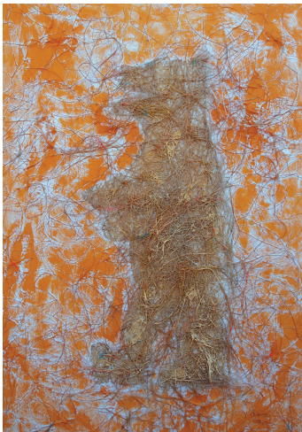
Из цикла „Карпатски мит”, 2014. (комбинирана техника, 100x70)