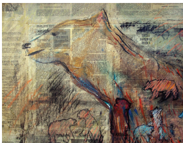
Све зависи од људи, 2014. (комбинирана техника, 40x50)