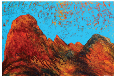
Из циклуса „Записи са метеора” 375, 2018. (комбинирана техника, 70x100)